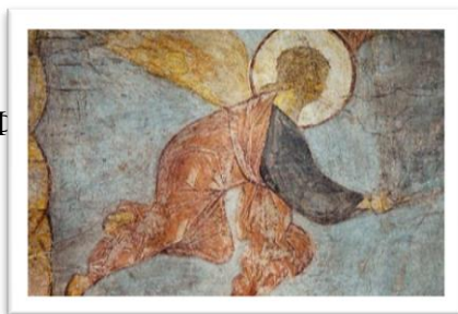
Владимир, Успенский собор, 1408 г