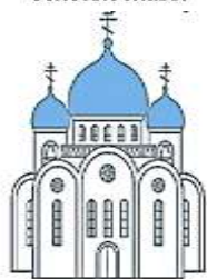
Голубые или синие главы

- Золотые купола символизируют Божественную славу. Поэтому златоглавыми чаще всего устраивают храмы, посвященные Господским праздникам (Рождества Христова, Крещения Господня, Пасха, день Воскресения Иисуса Христа.).