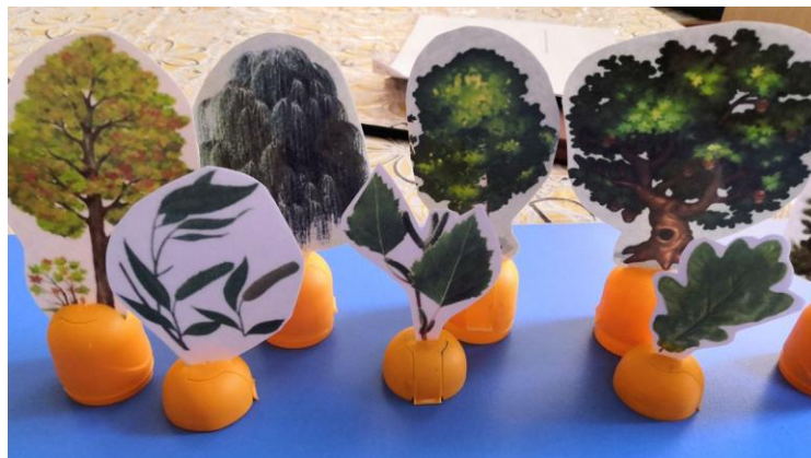
Дидактическая игра «С какого дерева лист»