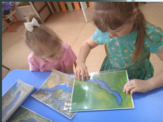
Дидактическая игра «Найди Байкал по контуру»