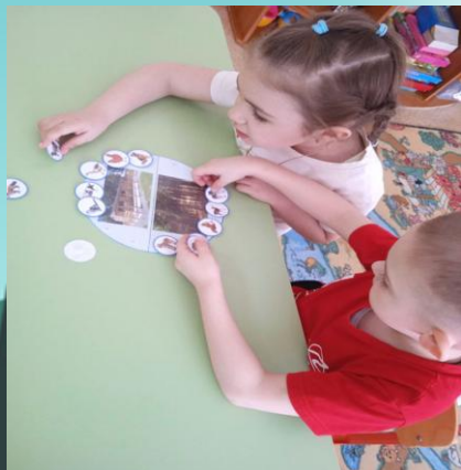
Дидактическая игра «Дикие и домашние животные Прибайкалья»