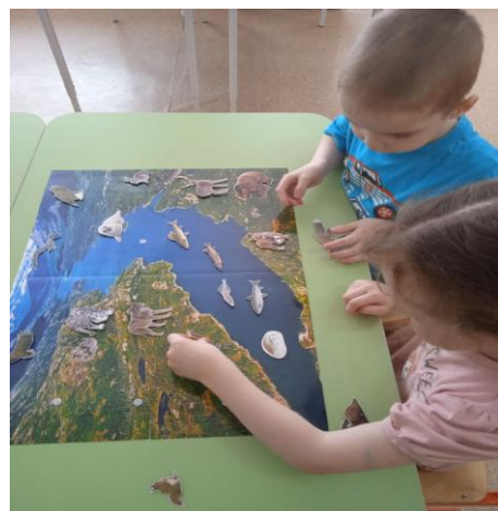
Панно «Байкал-жемчужина Сибири»