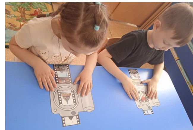
Дидактическая игра «Достопримечательности Тайшета»