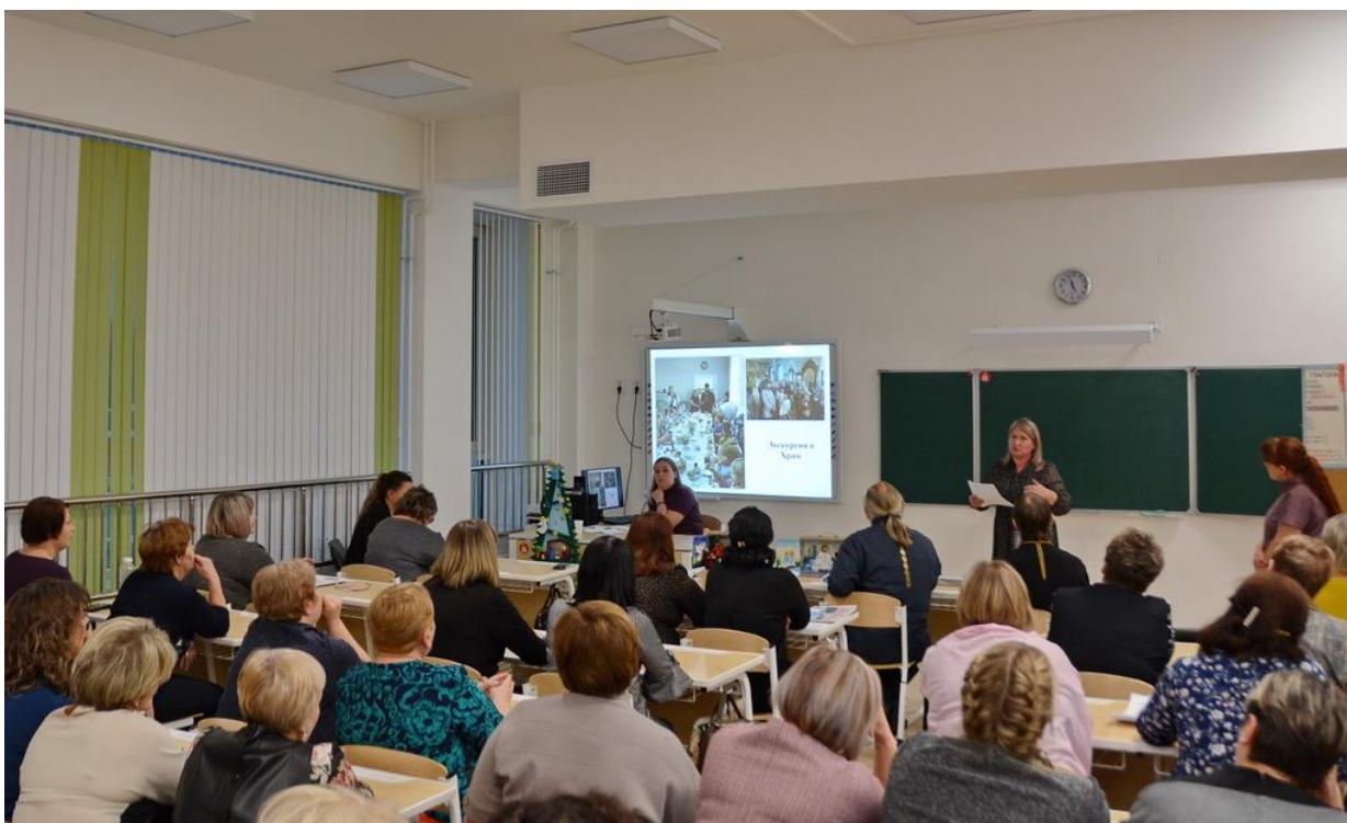
Секция воспитателей детских садов.

Самыми многочисленными были секции, посвящённые вопросам духовно-нравственного воспитания детей на основе православной традиции в образовательных учреждениях. В ходе подготовки к чтениям отделом религиозного образования и катехизации было принято к рассмотрению 54 доклада от педагогов образовательных учреждений городов Саянск, Зима, Тулун, Куйтунского и Тулунского районов. Докладчики от образовательных учреждений Нижнеудинского района были определены в ходе прослушивания на Рождественских чтениях, состоявшихся 29 ноября в городе Нижнеудинске. Докладчики от образовательных учреждений Тайшетского и Чунского районов были определены на Тайшетских межрайонных Рождественских образовательных чтениях 24 ноября.