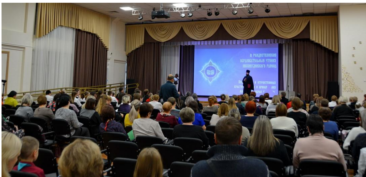
Нижнеудинск. Пленарное заседание.

22 ноября в городе Нижнеудинске состоялись Вторые Рождественские образовательные чтения Нижнеудинского района. Организатором церковно-общественного форума, который проводился по инициативе Нижнеудинского благочиния, выступили администрация Нижнеудинского района и отдел религиозного образования Саянской епархии.