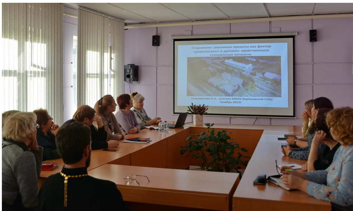
Чунский. Секция учителей школ.