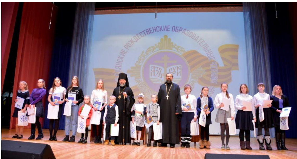
Награждение победителей конкурса "Красота Божьего мира".

Фото: работа участников VI Саянских Рождественских образовательных чтений на секциях.