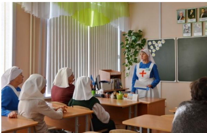
Фото: работа участников VI Саянских Рождественских образовательных чтений на секциях.